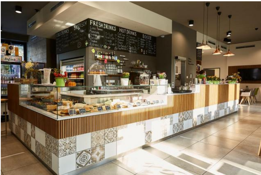
Lindbergh's Café, Gateway Gardens

Corona ist Mist. Ganz klar. Wenn es eine Branche gibt, die das beurteilen kann, ist es die Gastronomie.