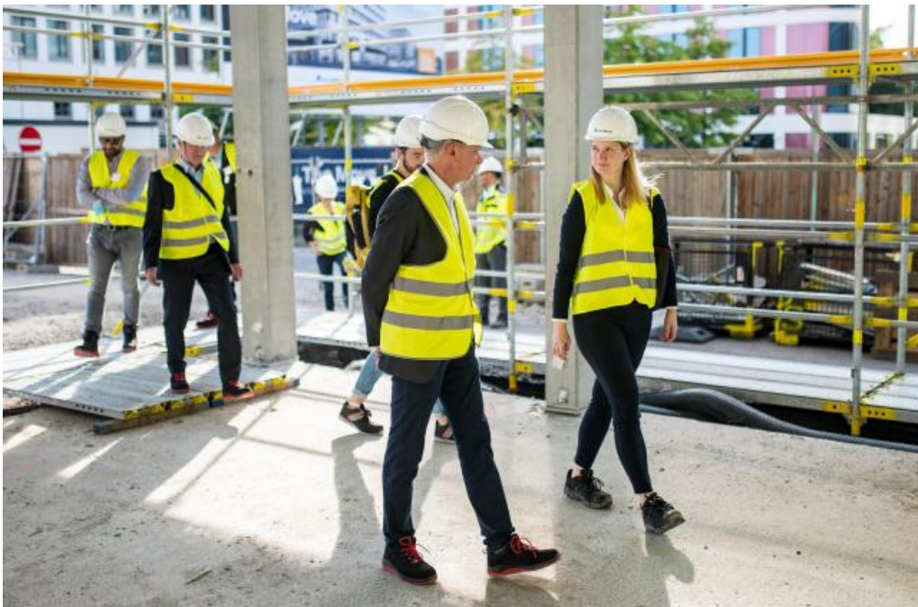
Baustellenbegehung "The Move" by Siemens

Standortentwicklung und New Work-Konzepte