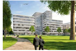
Europa-Center Gateway Gardens