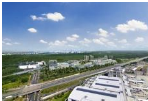
Blick Richtung Frankfurt

Die nachfolgenden Fotos, Grafiken und Animationen sind nur eine sehr kleine Auswahl. Mehr finden Sie auf unter www.gateway-gardnes.de im Pressebereich oder Sie kontaktieren uns direkt.