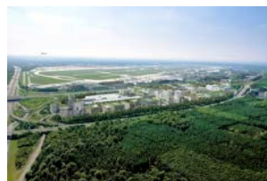
Blick Richtung Flughafen