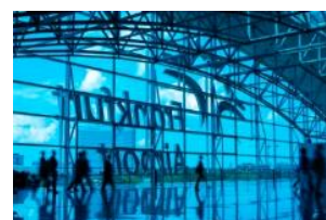
Blick von Terminal 2