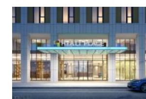
Hyatt Place Eingang