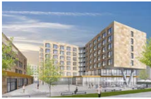
Gateway Gardens Plaza