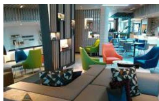
Holiday Inn Open Lobby