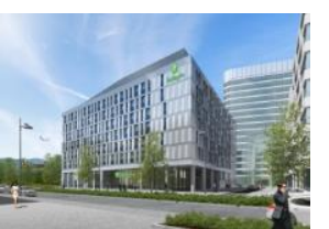
Holiday Inn Hotel