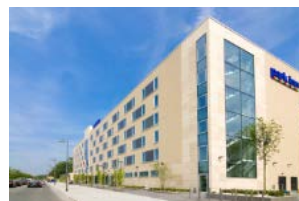
Park Inn Hotel