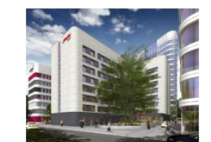
Hampton by Hilton