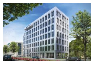
Lindbergh Parkside Office